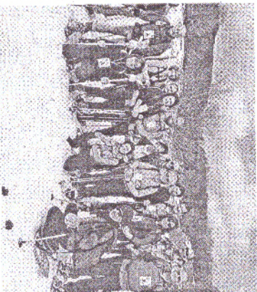
Il gruppo di foggiani in Abruzzo

Lo scorso 24 febbraio, in occasione dell'edizione 2017 di "M'illumino di Me-