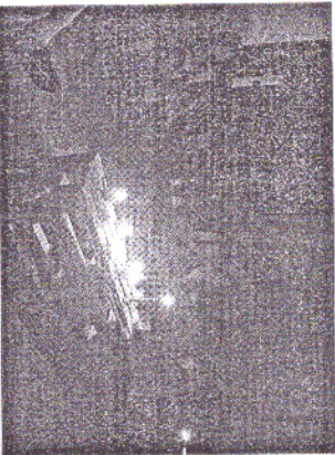
FOGGIA La cena a lume di candela