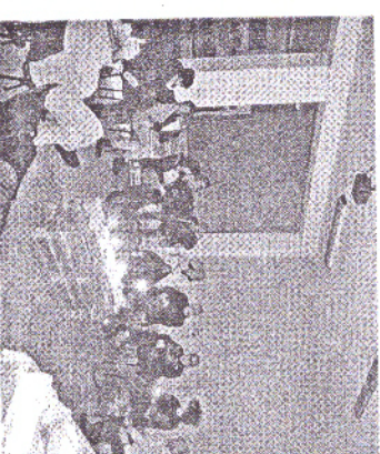
FOGGIA I soci Cai alla cena